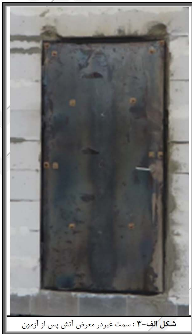
شکل الف-۳: سمت غیردر معرض آتش پس از آزمون