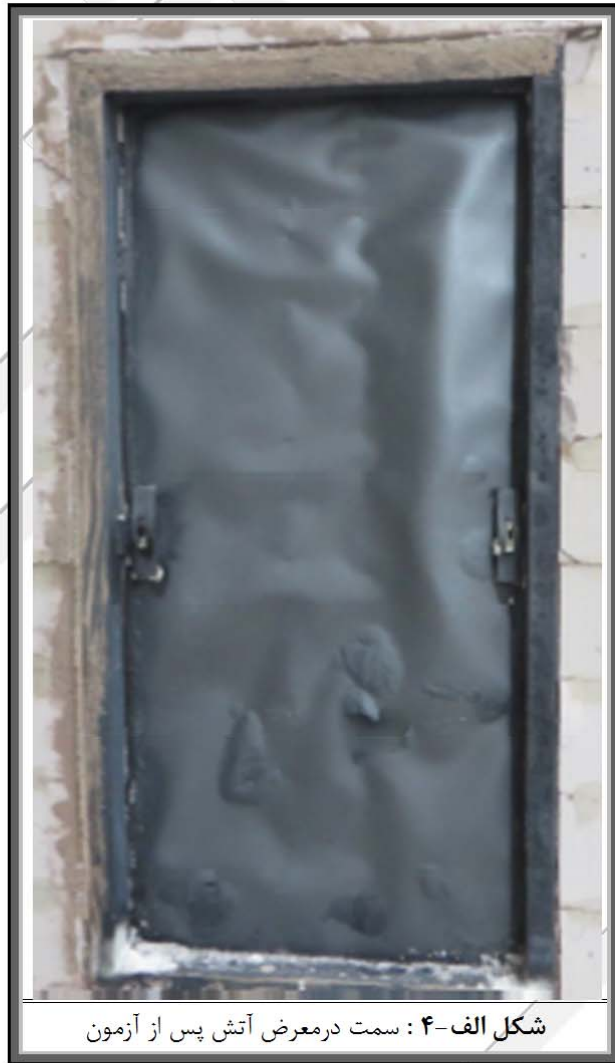
شکل الف-۴ : سمت در معرض آتش پس از آزمون